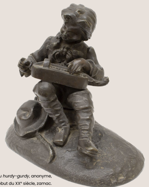
Petit Musicien de rue jouant du hurdy-gurdy, anonyme, début du XX e siècle, zamac.

Posticheur en placarde : athlète qui se produit dans les carrefours, sur les terre-pleins ou dans les places publiques et qui accompagne ses démonstrations d'un discours coloré et exagéré pour attirer l'attention du public.