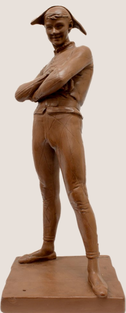
Arlequin, René de Saint-Marceaux, 1879, terre cuite.