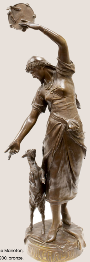
Esmeralda et sa chèvre, Eugène Marioton, entre 1895 et 1900, bronze.

Galoupe : garçon de cage dans la ménagerie, vient de Galoupo (italien) : domestique.