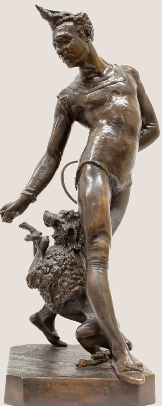
Get up, clown et son chien , Georges Petit de Chemellier, entre 1884 et 1907, bronze.

Glossaire distribué dans le cadre de l'exposition Fiers saltimbanques ! au musée des Beaux-arts et d'Archéologie de Châlons-en-Champagne, du 1 er au 22 septembre 2024.